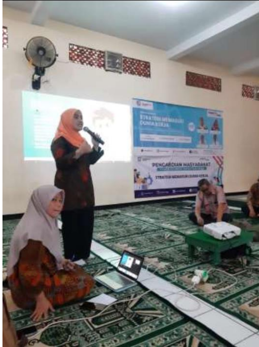
Gambar 3. Pemaparan Pembuatan Curriculum Vitae

Peran aktif dari tim dosen dalam melaksanakan kegiatan pengabdian diharapkan bisa membantu pihak SMK Teladan Jakarta Selatan dalam menjalankan tugasnya mendidik generasi muda dengan memberikan training, termasuk teknologi informasi dan bagaimana pemasarannya (Nu'man Afif, 2023). pengetahuan yang mampu beradaptasi dan bersaing dengan perkembangan digitalisasi dan budaya yang begitu cepat. Selain kompetensi yang dimiliki siswa siswi, diperlukan juga identifikasi terhadap kemampuan emosional (Fatimah Malini Lubis, 2023) yang mempengaruhi informasi yang ada di dalam curriculum vitae. Untuk itu dukungan yang tingginya terhadap tingkat kesadaran peserta didik