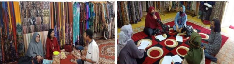
Gambar 3. Pelatihan dan Pendampingan Kegiatan Pembukuan, Akuntansi serta Perpajakan