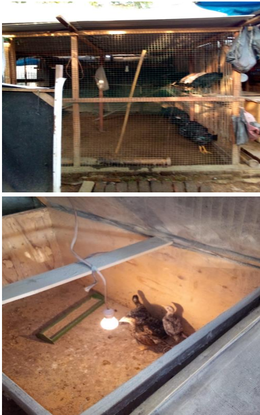
Gambar 1. Kandang Umbaran (Induk-an) dan Kandang Peti

Irian Barat No.55 Pasar V Desa Sampali Kecamatan Percut Sei Tuan Kabupaten Deli Serdang. Kandang umbaran (induk-an) sebanyak 1 (satu) buah dengan ukuran p x l (4m x 4m) dengan luas 16 m 2 saat ini menampung induk-an sebanyak 60 ekor Selain luas untuk kandang sisanya berupa pekarangan untuk melepas ayam induk-an dimana sekeliling sudah berpagar permanen.