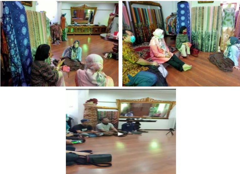
Gambar 1. Sosialisasi dan koordinasi kegiatan oleh Tim dan KUBE

rutin selama 3 bulan, dua kali setiap minggunya, mengambil waktu sore hari jam 15.00 , dipilihnya waktu sore hari karena UMKM dipagi harinya memproduksi atau menenun kain dan memasarkannya. Pendampingan di bidang pembukuan, Keuangan dan perpajakan diberikan oleh Nara sumber yang mempunyai Kompetensi mengajar dan melatih bidang tersebut, yang juga staf pengajar pada Ikatan Akuntan Indonesia (IAI) Palembang dan juga Ketua Tax Centre Politeknik Negeri Sriwijaya. Selanjutnya sosialisasi pengetahuan legalitas dengan mendatangi nara sumber pada Dinas Koperasi dan UMKM SumSel, sedangkan pengurusan legalitas didampingi oleh notaris Mahani, SH.