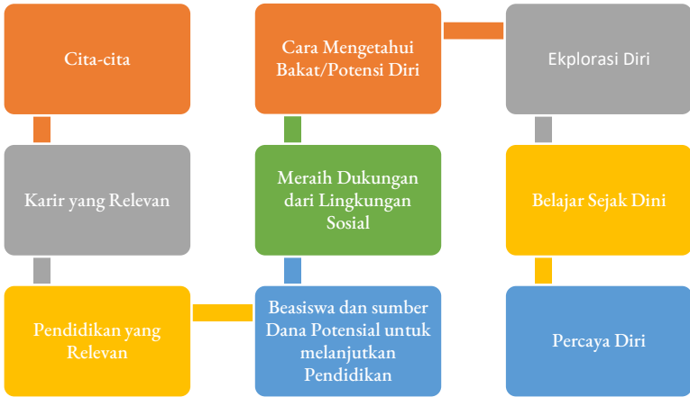
Bagan 1. Materi Motivasi

Langkah-langkah mengenyam Pendidikan yang perlu ditempuh untuk mencapai karir tertentu. Berikut adalah bagan deskripsi materi yang diberikan saat kelas motivasi.