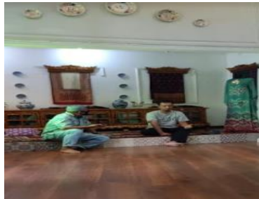
Gambar 4. Sosialisasi Legalitas usaha oleh Departemen Koperasi dan Pendampingan oleh Tim pelaksana dan notaris.

Hasil penerapan Teknologi membawa nilai tambah UMKM tertera pada tabel 1.