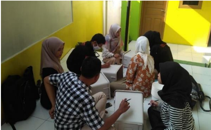
Gambar 2. Tim Pengabdian Melukis Tempat Sampah

ditempatkan di sekolah, diharapkan akan mempermudah siswa untuk memilah sampah jenis organik dan anorganik.