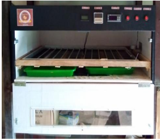
Gambar 2. Teknologi Tepat Guna Mesin Penetas Telur Kapasitas 200 butir

Penggunaan mesin penetas telur ayam ini mempunyai beberapa keunggulan. Pertama, temperature udara bisa diatur sesuai dengan kebutuhan sehingga tidak dilami lagi temperature yang rendah atau dingin yang mengakibatkan telur mmenjadi busuk.Kedua, mesin penetas telur secara berkala dan otomatis memutar telur sehingga temperature merata keseluruh sisi telur yang sangat sulit jika dilakukan secara manual. Selanjutnya pengoperasian mesin penetas telur ayam tersebut dimulai pada bulan April 2023. Hasilnya penggunaan mesin penetas telur cukup memuaskan karena persentasi keberhasilan penetasan telus mencapai 99,5%. Berikut gambar anak-an ayam kampung yang telah berhasil ditetaskan yang ditempatkan di beberapa kandang peti.