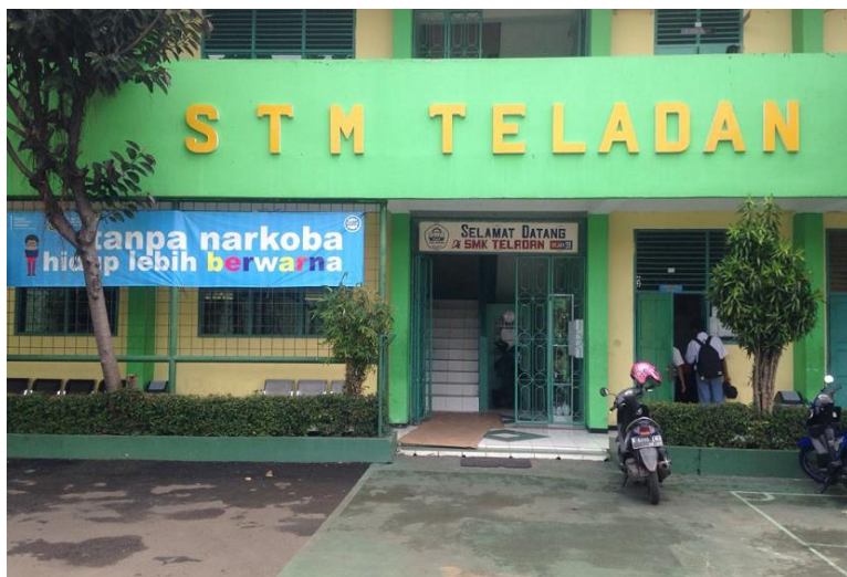
Gambar 1. Gedung SMK Teladan Jakarta Selatan

Sedangkan visinya adalah sebagai berikut: (1) meningkatkan pembinaan akhlak penyelenggara dan masyarakat sekolah, (2) meningkatkan kualitas manajemen pendidikan, (3) meningkatkan kerjasama sekolah dengan dunia usaha/industri dan asosiasi profesi, (4) meningkatkan kuantitas dan kualitas sarana dan prasarana Pendidikan, (5) meningkatkan pembinaan kesiswaan dan ekstrakurikuler, (6) mengembangkan budaya kewirausahaan dilingkungan sekolah. SMK Teladan berlokasi di Jl. Raya Srengseng Sawah No.74 Kelurahan Srengseng Sawah, Kecamatan Jagakarsa. Jakarta Selatan 12640.