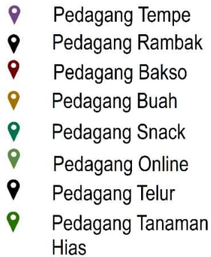
Gambar 1. Simbol dan Jenis UMKM