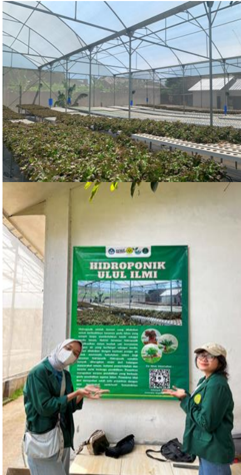
Gambar 1. Kunjungan pada pondok pesantren terkait progress pembuatan media interpretasi dan paket wisata berkebun hidroponik sebagai sarana edukasi

kelompok fokus, untuk mengumpulkan wawasan dari pengelola pesantren dan santri