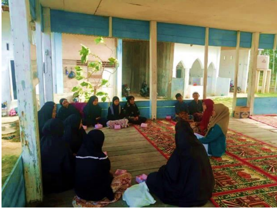
Gambar 1. Dokumentasi Kelas Motivasi

masih dapat dikatakan kurang memadai. Hanya sekolah-sekolah negeri unggul dan swasta yang memiliki fasilitas Pendidikan yang cukup. Hal ini menjadi salah satu faktor penghambat mobilitas sosial masyarakat.