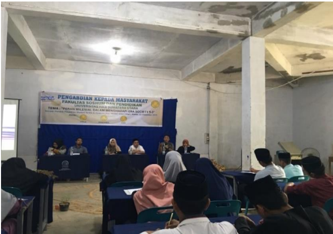
Gambar 3. Kegiatan Pengabdian Masyarakat

Dengan cara memberikan penyuluhan dan motivasi tentang pentingnya jiwa berwirausaha dengan memperhatikan lingkungan yang nantinya hasil dari kegiatan ini akan menumbuhkan minta dan pengetahuan berwirausaha remaja dimana mereka dapat mengembangkn potensi yang ada di lingkungan tempat tinggal mereka.