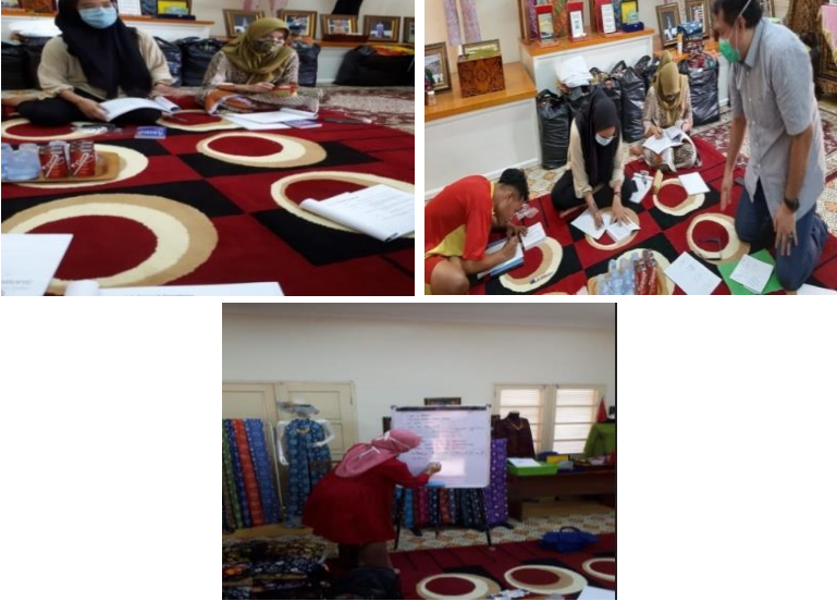
Gambar 2. Pelatihan Bahasa Inggris praktis