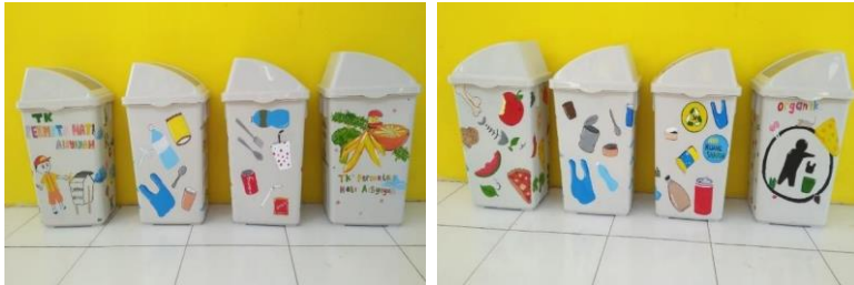
Gambar 3. Tempat sampah berkarakter