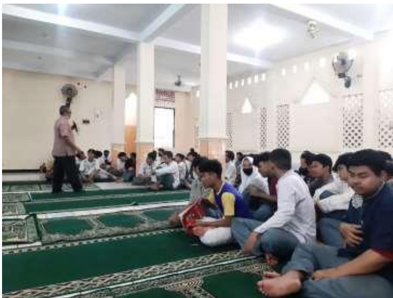
Gambar 2. Siswa – Siswi SMK Teladan Jakarta Selatan

napa yang direncanakan. Peserta mendapatkan banyak sekali manfaat dari kegiatan pengabdian ini. Diharapkan siswa siswi mampu dan memahami dengan baik bagaimana membuat curriculum vitae yang baik dan menarik. Melalui pelatihan ini diharapkan siswa-siswi SMK Teladan dapat terbantu dalam mempersiapkan diri untuk memasuki proses rekrutmen dan mengirimkan lamaran pekerjaan dengan baik menghadapi wawancara kerja dengan baik sehingga diharapkan siswa siswi dapat diterima bekerja pada perusahaan dan bidang pekerjaan yang mereka idamkan. Melalui penguatan karakter ini juga bisa mengingatkan kembali bagi peserta didik yang tinggal di Jakarta bagaimana kearifan budaya lokal Jakarta (Kartini, 2021).