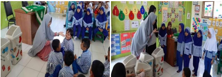
Gambar 4. Menjelaskan Fungsi Tempat Sampah Organik dan Anorganik

didukung oleh seluruh guru di TK Permata Hati Aisyiyah Muhammadiyah Kota Tasikmalaya. kegiatan dilakukan dengan memberi penjelasan tentang tempat sampah, fungsi dan cara memanfaatkannya. Setelahnnya dilanjutkan dengan simulasi pada siswa-siswi untuk mengetahui pemahaman bagaimana membedakan organik dan anorganik pada sampah yang akan dibuang pada tempatnya