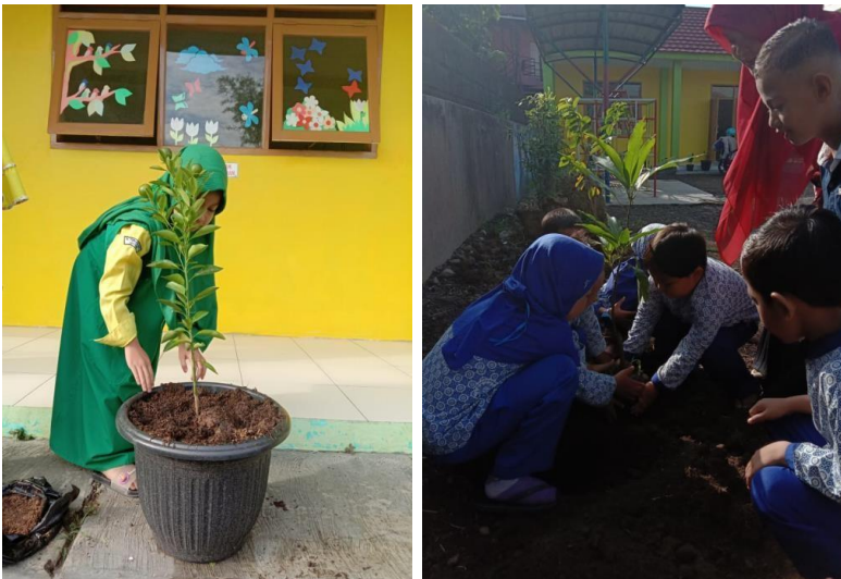
Gambar 5. Penanaman buah dan bunga

menambah estetis atau keindahan dan bermanfaat karena menghasilkan bahan obat dan bahan makanan. Partisipasi siswa-siswa dalam menanam dan menata pekarangan sekolah berdampak baik terhadap kepedulian siswa pada tanaman-tanaman tersebut. Setiap hari siswa-siswa bergilir menyiram tanaman dan melaporkan pada guru jika ada tanaman yang tampak layu atau kering. Partisipasi siswa yang membawa tanaman dari rumahnya masing masing berdampak pada rasa memiliki dan tanggung jawab akan tanamannya tersebut. Antusiasme siswa menjaga dan memelihara tanamannya juga mendorong siswa lainnya yang belum membawa tanaman.