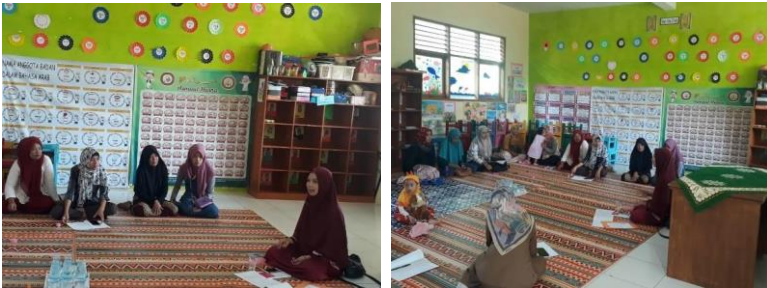
Gambar 1. Sosialisasi Kepada Orangtua Siswa

Keluarga sebagai agen sosialisasi pertama dan utama dalam pembentukan berbagai nilai dan norma dalam kehidupan. keluarga, khususnya orangtua menjadi fasilitator penyampaian hal-hal yang penting berkaitan dengan bagaimana seharusnya memperlakukan lingkungan tempat kehidupan sehari-hari, baik berupa lingkungan tempat tinggal (rumah), maupun lingkungan tempat menimba ilmu (sekolah).