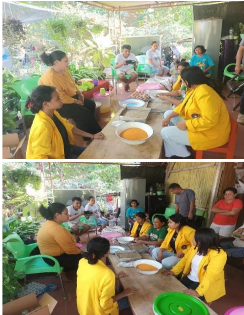
Gambar: Kegiatan Program Kemitraan Masyarakat