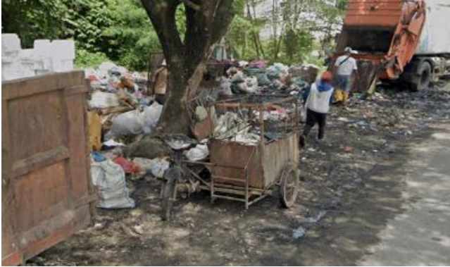
Gambar 2. Kondisi TPS disekitar Pondok Pesantren Modern Ta'dib Al-syakirin

Pondok Pesantren Modern Ta'dib Al-Syakirin merupakan sebuah lembaga pendidikan yang memiliki konsep pendidikan yang bersifat sebagai “kurikulum kehidupan” dimana prinsip-prinsip dasar pesantren yang disebut dengan “Panca Jiwa ”: jiwa keikhlasan, kesederhanaan, ukhuwah Islamiyah, kemandirian dan jiwa kebebasan, kesemuanya mewarnai keseharian dalam kehidupan mereka. Konsep pendidikan tersebut tertuang pada visi Pondok Pesantren Modern Ta'dib Al-syakirin yaitu “Membentuk Generasi Muda Muslim yang berbudi tinggi, berbadan sehat, berpengetahuan luas, berfikiran bebas dan dapat berkhidmat kepada masyarakat.”