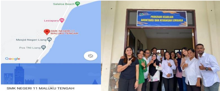
Gambar.1 Peta Lokasi SMK Negeri 11 Maluku Tengah

Pada era digitalisasi kreatifitas siswa menjadi sangat penting, karena itu perlu pembekalan program komputasi seperti Microsoft Office yaitu Microsoft excel . Microsoft excel di berbagai kebutuhan sering digunakan seperti menyusun laporan keuangan (Fajrinsanty, dkk 2019), pelatihan dalam pengelolaan data dan penyusunan laporan keuangan (Mulyani, dkk, 2019) Oleh karena itu bentuk kegiatan yang dilakukan sebagai bentuk pelatihan keterampilan siswa dalam menggunakan microsoft excel sebagai media pembelajaran akuntansi saat ini menjadi kebutuhan utama dan sangat penting, bentuk kegiatan yang dilakukan sesuai dengan kebutuhan siswa terkait penyusunan laporan keuangan yang dimulai dengan mengelompokan transaksi, menjurnal, memposting ke buku besar, neraca saldo, dan pembuatan neraca lajur yang didalamnya memuat laporan keuangan (neraca, laporan laba/rugi, laporan arus kas, dan laporan perubahan ekuitas)